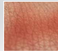
Rötungen sind eine entzündliche Reaktion der Haut auf bakterielle oder allergene Reize.