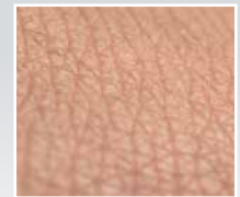
Verbesserung des Hautbildes nach Pflege mit einer MicroSilver BG™-haltigen Creme.