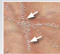
MicroSilver BG™ lagert sich depotartig im Hautrelief an, ohne die Haut zu durchdringen.

SymRelief®* : Die Verbindung aus organisch kultiviertem Ingwerextrakt und Bisabolol (Kamillenextrakt) wirkt ebenfalls in der Immunreaktion und stoppt Entzündungsbotschaften schnell. Das bedeutet bis zu 49 Prozent weniger Rötung bereits innerhalb von zwei Tagen.